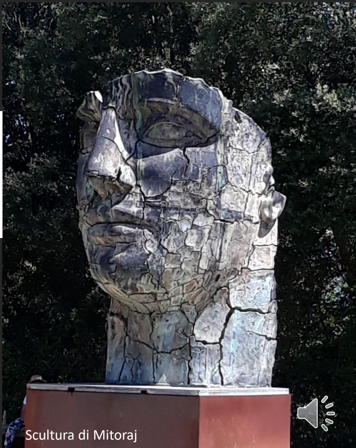
Scultura di Mitoraj

Il passaggio del tempo...ma qualcosa resta sempre dentro o fuori di noi... nelle crepe anche un respiro di bellezza