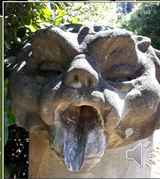
Fontana dei Mostaccini (1619-21)