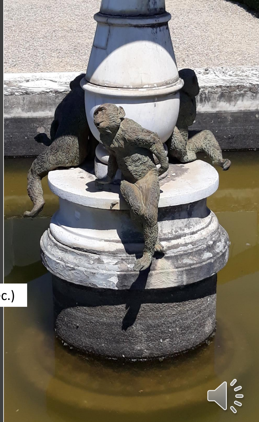
Fontana delle Scimmie (ambito di Pietro Tacca XVII sec.)

Un'acrobazia dispettosa appena conclusa le tre scimmiette han trovato momentaneo rifugio perenne in una fontana, adesso scampata l'acqua stagnante ammiccano curiose a chi passa di lì